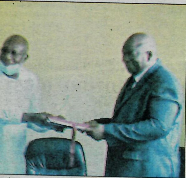
...a (àd) a reçu les charges liées à sa nouvelle fonction

...iée est lourde. ...tenez-moi. Si ...ous soutenir, on ...nistration nous ...il fait savoir ...son prédéces- ...il a remercié ...enus de l'inté- ...être témoins ...émonie. ...a Yacouba a ...nt que la céré- ...e à Allah. Cissé ...t depuis le 28 ...fait son bilan ...reau pour l'interprofession bétail ...viande et lait, un secrétariat ad- ...ministratif. Nous avons œuvré ...pour le rapprochement de la fédé- ...ration avec les acteurs, renforcé ...l'assiette financière, signé des ...partenariats avec des banques no- ...tamment pour financer l'opération ...Tabaski, signé des accords et fait ...des ateliers, initié des projets. Je ...serai aux côtés du nouveau prési- ...dent », a-t-il souligné.